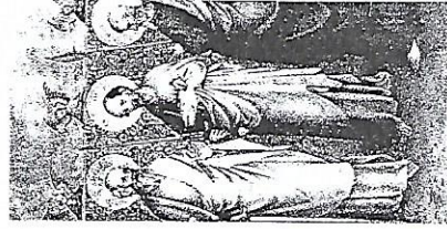
Maestro degli Altari di Hesterbach, Gli apostoli Simone, Giuda Taddeo e Mattia, sec. XV. Monaco, Alte Pinakothek.

5) PRIMA DI SCEGLIERE PREGANO IL SIGNORE. POI TIRARONO A SORTE PERCHÉ: